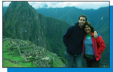
¡Estamos en Perú!